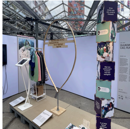
Data als onbekende vervuiler

Goed dus om stil te staan bij onze digitale gewoontes. Door kritisch te kijken naar wat je bewaart en wat niet, maak je niet alleen je digitale werkplek overzichtelijker, maar lever je ook een concrete bijdrage aan duurzamer werken binnen het Rijk.